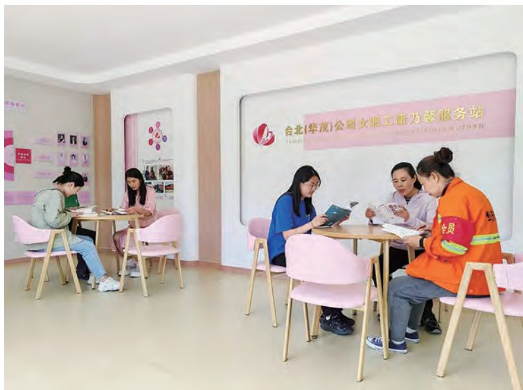
9月25日，台北(华茂)公司工会组织女职工在康乃馨服务站开展“巾帼同行”女职工读书活动，通过分享读书经验，交流读书感想，让巾帼魅力在书香中绽放。

立足于“办”，持续推进权益维护精准化。开展送温暖、金秋助学等帮扶救助活动，通过“背靠背”入户了解和“拉网式”单位调查，及时掌握实际情况，深化困难职工档案的动态化管理，以增强帮扶的针对性和实效性。同时，重视女职工的特殊权益，做好女职工“五期”保护工作，切实维护女职工身心健康和特殊权益，扎实做好女职工关爱实事。（耿丽圆）