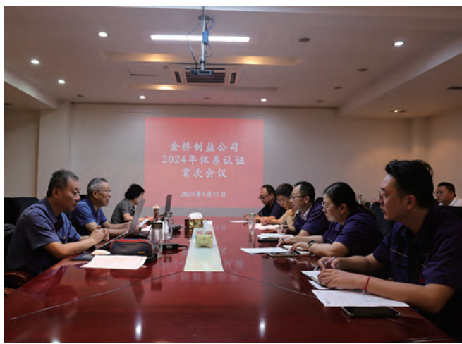
近日,金桥制盐公司通过北京世标认证中心审核,给予食品安全管理体系、环境管理体系和职业健康安全管理体系认证,给予质量管理体系认证“再次注册”的再认证审核结论。通过审核,是对公司精细化管理成果的检验,促进内控管理水平持续提升。(李晓月)

谱写四个篇章。围绕“准盐文化、市场开拓、智能制造”四个篇章,扎实推进产业高新化、数字化转型,产业发展加速升级。按照原盐生产“机械化、实用化、效益化、自动化”发展为方向,全面提高传统制盐基础治理融合水平,结合“准盐”深厚的历史文化和光荣的红色血脉,着力打造高品质食用原料海盐生产基地品牌。同时将红色元素融入“准盐”品牌建设全过程;优化原盐营销策略,拓宽原盐销售渠道。巩固智能化扒盐机研发成果,完善生产管控和现有信息系统功能,进一步提升企业综合竞争力。(许彦彦)