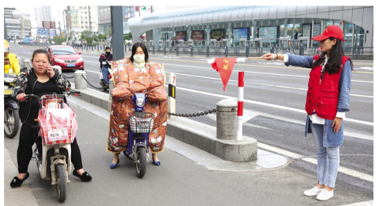
台北投资公司积极响应连云区文明办号召,组织8名青年志愿者在连云区交通路口维护交通秩序,确保行人安全,身体力行积极参与创卫工作。(顾劲峰)