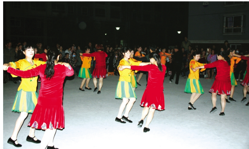
10月13日晚,在灌西投资公司西海岸风情小区的广场上,人山人海,来自西海岸风情小区、灌西社区、燕尾新城小区的广场舞爱好者同场竞技,围观的职工群众达千余人。此次广场舞交流集会是由民间自发组织的一次活动,通过大家同场竞技,切磋技艺,丰富职工群众的业余文化生活。(季兴胜)