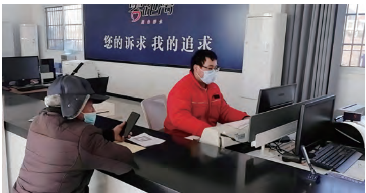
为解决辖区内部分用电客户路途遥远和孤寡老人行动不便等问题，供电工程分公司纪检携手青口供电所推行一线工作法，党员志愿服务队走乡访村，在村支部设立移动“收费厅”，贴心服务用户，手牵手惠民。（匡健 王雨）

六清行动“强链”提质效。坚持问题、目标“双导向”，围绕“聚焦解放思想、聚力提质增效”工作中心，开展“清查资源资产保权益、清理历史矛盾保稳定、清收债权资金保发展、清除风险隐患保安全、清稿制度修编保规范、清健作风形象保勤廉”“六清六保”行动，提升企业经营管理效能，保障企业持续、健康、稳定发展。（陈健）